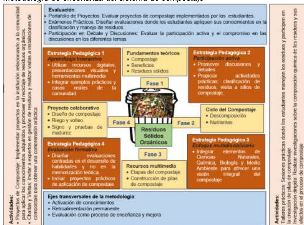
Figura 2 Metodología de enseñanza del sistema de compostaje

La metodología propuesta se estructura en cuatro fases ordenadas y complementarias. La fase uno corresponde a "Fundamentos Teóricos" donde se abordan los conocimientos básicos y beneficios del compostaje, también se analiza el tema de residuos sólidos. La fase dos aborda el "Ciclo del Compostaje", en el cual se estudia la descomposición orgánica, la producción de nutrientes y su aplicación en la vida real de los estudiantes. La fase tres llamada "Recursos Multimedia" integra tecnología y herramientas visuales para mejorar la comprensión y el interés de los estudiantes hacia el proceso de compostaje. Finalmente, la fase cuatro contempla el "Proyecto Colaborativo", donde se materializan los conocimientos teóricos en actividades prácticas.